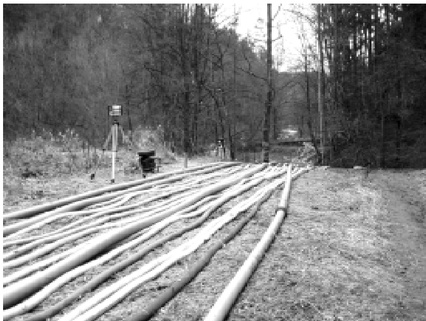
Alternativní řečiště Bílé vody kolem Nové Rasovny.