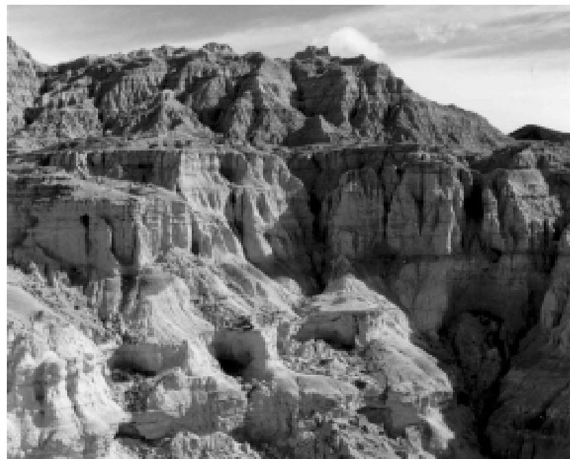
Pohled na stěny lokality Gran Barranca s mohutnými ústími vertikálních dutin. Mocnost vrstev zachycených na snímku je minimálně 100 m.

1. strana obálky: Hasičské cvičení - traverz přes propast Macochu. 4. strana obálky: Měření vydatnosti vývěru podzemních vod do Berounky v lednu 2004.