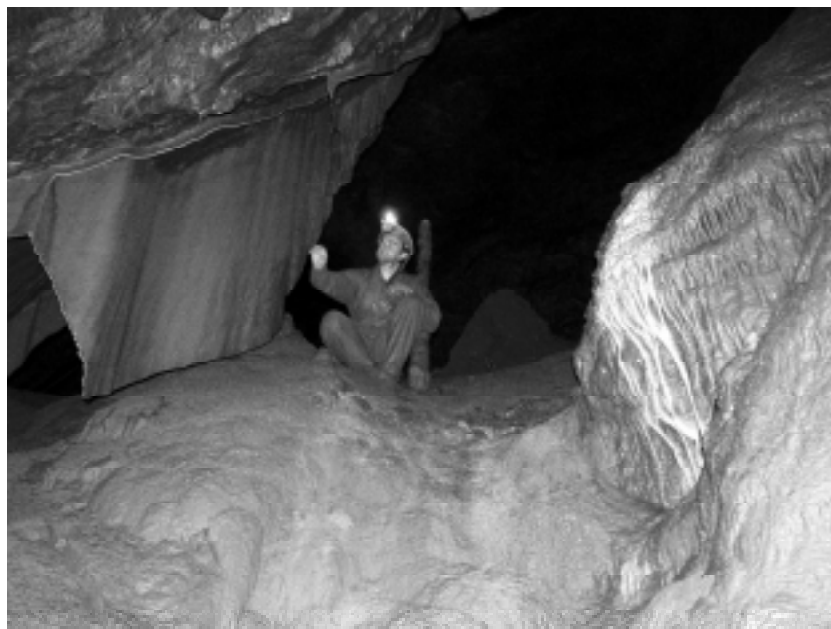
Nová Rasovna, Jeskyně pravěkých symbolů – Dóm sloních uší