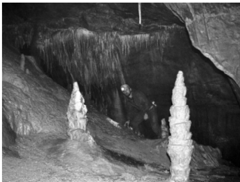
Nová Rasovna, Jeskyně pravěkých symbolů – Mahátmova kaplička