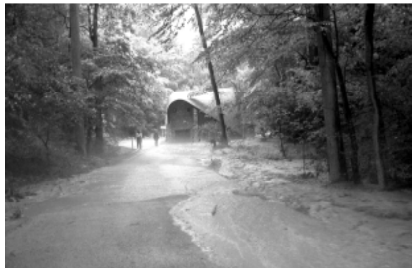
Pustý žleb, spodní stanice lanovky – situace po povodni ve Sloupě dne 26.5. 2003.