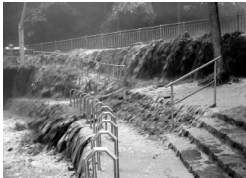
Punkevní jeskyně, přístaviště – situace po povodni ve Sloupě dne 26.5. 2003.